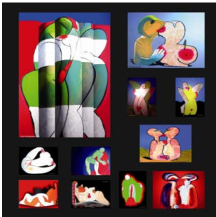
“Le curve della mente” a cura di D. Ciotola, Museo Nazionale Castel Sant’Angelo, Roma, marzo 2007